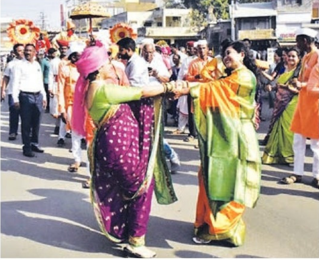
मिरज येथे शुक्रवारी महाराष्ट्र कामगार कल्याण मंडळामार्फत आयोजित १७ व्या कामगार साहित्य संमेलनानिमित्त शहरातून ग्रंथदिंडी काढण्यात आली. यावेळी पारंपरिक वेशभूषेत महिलांनी फुगडीचा फेर धरला.