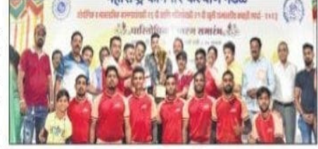
जेएसडब्ल्यू ग्रामीण विजेता संघ