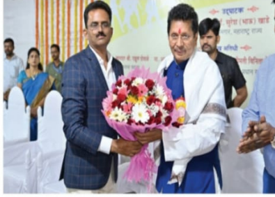
खेळांला या विजयाचे श्रेय जाते.