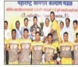
बँक ऑफ बडोदा शहरी विजेता संघ