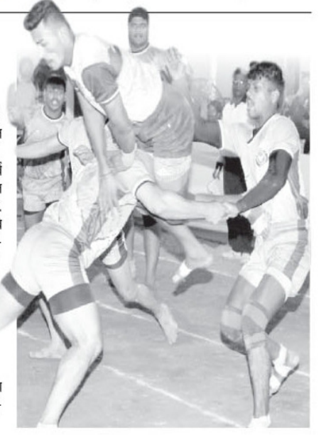
आ का श यांच्या चढाई-खेळामुळे.