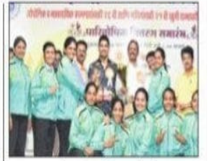
महिलांचा पश्चिम रेल्वे संघ