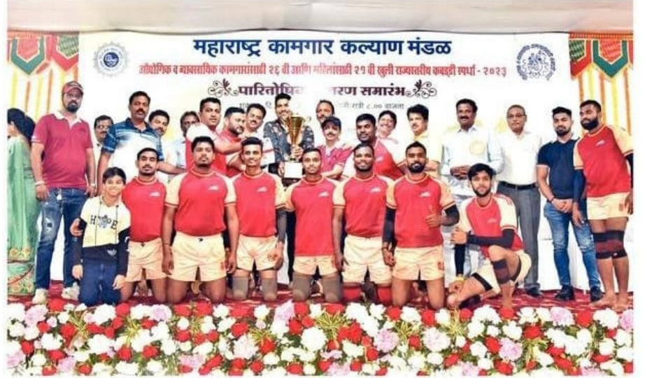
सलग चौथ्यांदा जिंकलेला रायगडचा जेएसडब्ल्यू कंपनीचा संघ.

पश्चिम रेल्वेने बँक ऑफ बडोदाला २९-२७ असे चकवले. विश्रांतीला १८-१६ अशी रेल्वेकडे आघाडी होती. ती त्यांनी टिकवली.